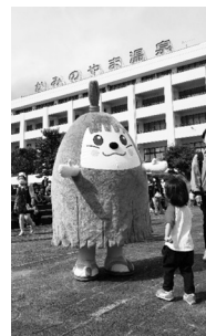
【けやきの森のおまつり↑】