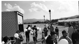
【スマイルプロジェクト↑】