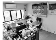
楽器のメンテナンス用品等を販売